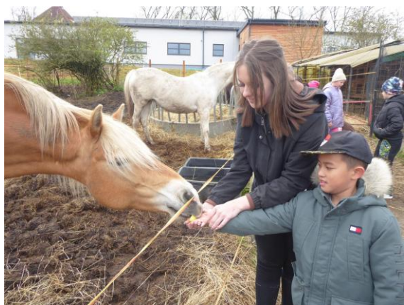
MINIZOO v Sově