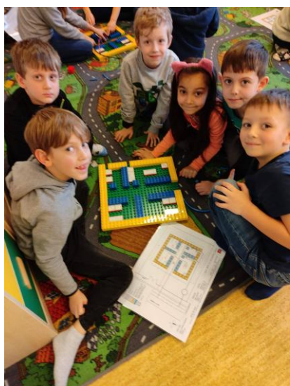
Malá technická univerzita - Malý inženýr