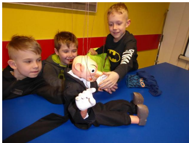
Muzeum - Loutky