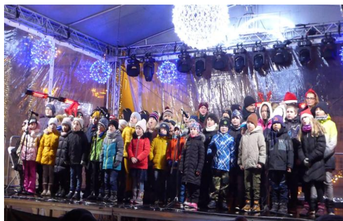
Vánoční zpívání na náměstí