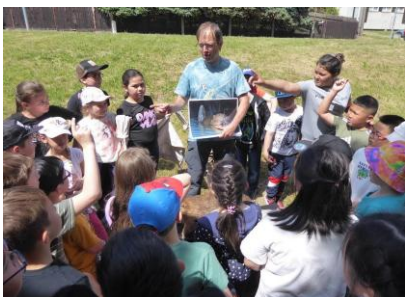
Život bobrů u řeky